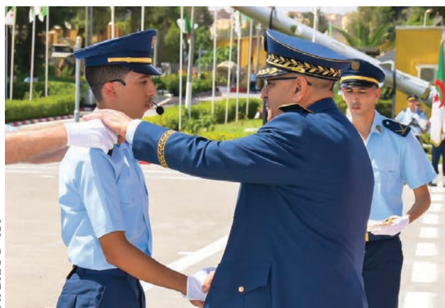
Ph DRIC 1 re RM

● la 51 e promotion d'élèves sous-officiers contractuels■