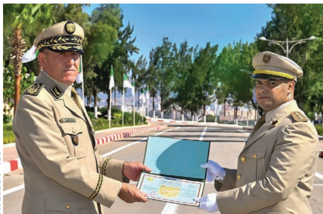
Ph DRIC 5 e RM