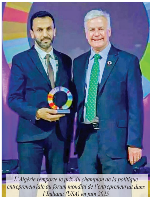
L'Algérie remporte le prix du champion de la politique entrepreneuriale au forum mondial de l'entrepreneuriat dans l'Indiana (USA) en juin 2025