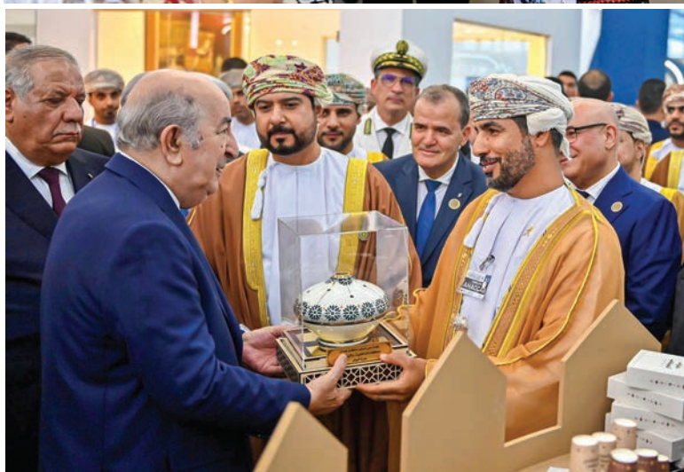
▲ Monsieur le Président de la République visite les pavillons de Palestine et du Sultanat d'Oman, invité d'honneur.

textiles et cuirs Getex, où il a suivi une présentation du bilan du groupe. Ce dernier a connu, ces dernières années, un saut qualitatif en matière de diversification de la production, d'amélioration de la qualité, de développement et de modernisation des modes de distribution, en partenariat avec des start-up spécialisées dans le e-commerce.