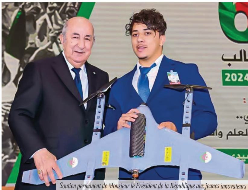
Soutien permanent de Monsieur le Président de la République aux jeunes innovateurs

les pratiques dans cette direction. Un pari ambitieux misant sur les compétences nationales, en particulier sur les jeunes créateurs et innovateurs.