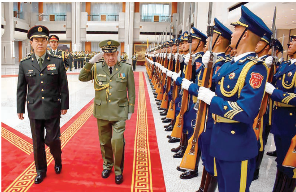
► Monsieur le général d'armée Saïd Chanegriha lors de sa visite en Chine, en novembre 2023.

investissements, l'activation du rôle des attachés économiques dans les ambassades, ainsi que le recadrage des conseils d'hommes d'affaires et le renforcement de leur partenariat avec la communauté algérienne à l'étranger.