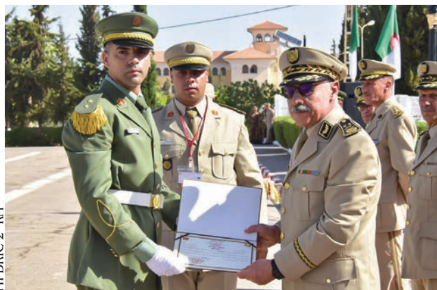
Ph DRIC 2 e RM

certificat militaire professionnel (2 e degré), spécialité administration sanitaire ; ● la 28 e promotion du