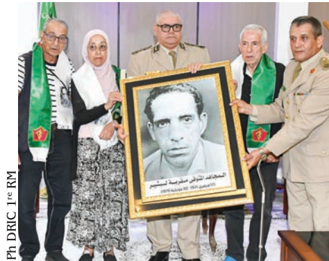
Ph DRIC 1 re RM