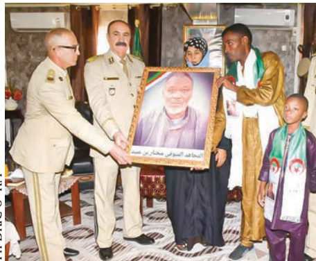
Ph DRIC 6 e RM