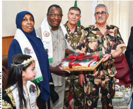
Ph DRIC 4 e RM