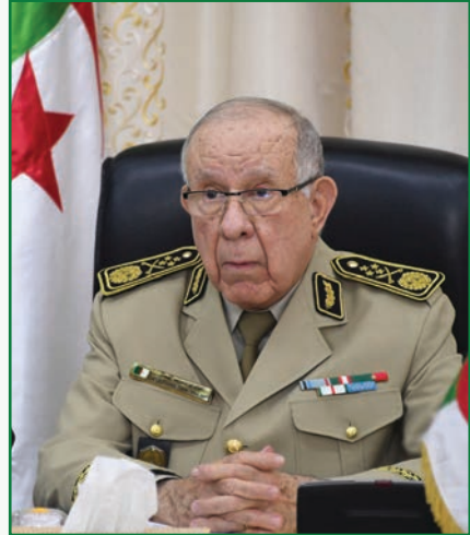
Général d'armée Saïd Chanegriha

Enfin, je ne peux que renouveler mes sincères félicitations à l'ensemble des personnels de l'Armée nationale populaire, toutes catégories confondues et à tous les niveaux de responsabilité, en les invitant, en cette occasion solennelle, à observer un moment de recueillement à la mémoire des Chouhada des résistances populaires, de la Révolution libératrice bénie et des martyrs du devoir national. Qu'ils s'inspirent de leurs épopées héroïques et de la sincérité de leurs sacrifices pour élever le niveau d'accomplissement des missions constitutionnelles qui leur sont confiées, dans le but d'atteindre les objectifs escomptés■