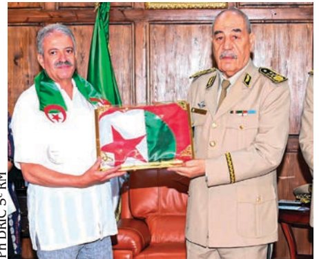
Ph DRIC 5 e RM