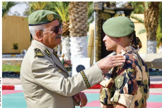
Ph DRIC 4 e RM